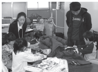
寺子屋での子どもたち