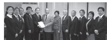
舛添厚労大臣への要望書提出