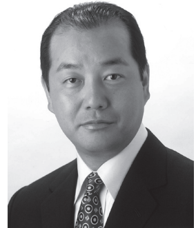
自民党北区総支部長 東京都議会議員 高木けい

私たちの東京都は、予算規模で国連加盟国192カ国中、第7位の大きさと言われるほど、一地方自治体としては比類なき規模を誇ります。東京はわが国の頭脳部・心臓部であるだけでなく、アジアをリードする大都市であることは紛れもない事実です。