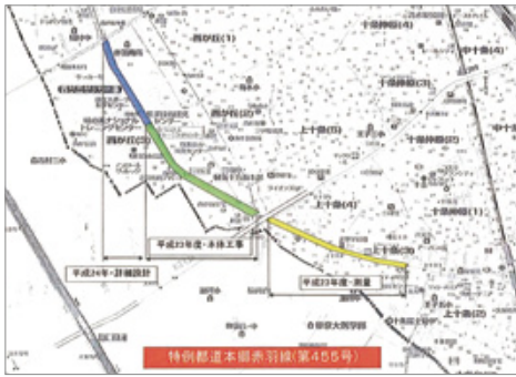
電線共同溝事業箇所図

補助85号線の一部(環七姥ヶ橋から上十条3丁目まで)が、24年度より電線類の地中化に向けた測量が決定し行われております。また姥ヶ橋からナショナルトレーニングセンターにかけての西が丘地区は、詳細設計並びに本体工事がスタートします。日本の電線類の埋設率は世界的にみて極端に低く、東京23区(市街地全体)43%、東京23区(市街地全体)7%、全国(市街地)の幹線)13%、全国(市街地全体)2%。ちなみにロンドン・パリ・ボンは100%、ニューヨーク72.1%。我が北区においては区道総延長33.6kmの内、3.2kmですから、1%にも満たない状況です。今回の補助85号線の電線共同溝事業(無電柱化)は今後区役所まではもちろんのこと、区内の埋設率をさらに高めていくための重要な事業となりますので、今後も推進に向けて活動して参ります。