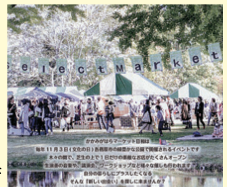
【写真】毎年11月3日、市の公園で素敵なイベント開催

歴史的な財産を利用してターゲットを絞り込み、予算がないにもかかわらずコマース、ドラマを若手職員や市民参加によりターゲット層が好む仕上がりになっています。市長が変わり若返ったこと、市民の意見を聞き、公共施設やホームページに許可があれば自分の名前を出して掲載するという姿勢にたいへん感心しました。予算がないからといって決して妥協せず、しっかりとしたセンスのあるものを作り、移住定住に取り組む熱意を示していました。