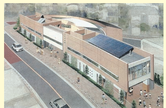
(西ヶ原南保育園の完成予想図)

今後、保育所の待機児童を解消し保育需要の増加や保護者のニーズの変化に対応するため、保育所の定員増や多様な保育サービスの充実を進め、子育てしやすい環境の整備を図ることになっています。